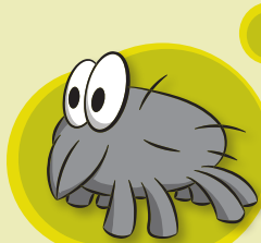
ACARI DELLA POLVERE