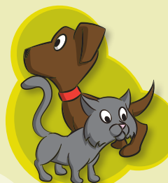
PELI DI CANE E GATTO